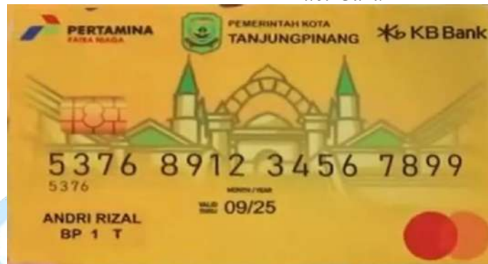
Gambar 1. 1 Kartu Fuel Card