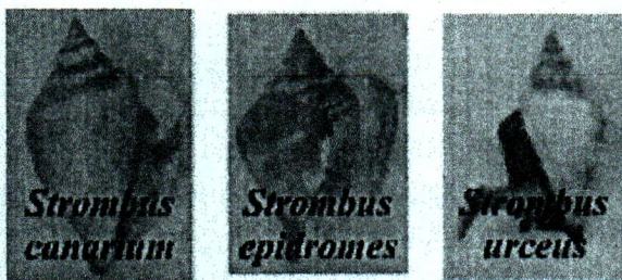
Gambar 3.1. Siput Gonggong

Berdasarkan hasil penelitian, ditemukan tiga jenis Siput Gonggong yaitu Strombus canarium , Strombus epidromis dan Strombus urceus .