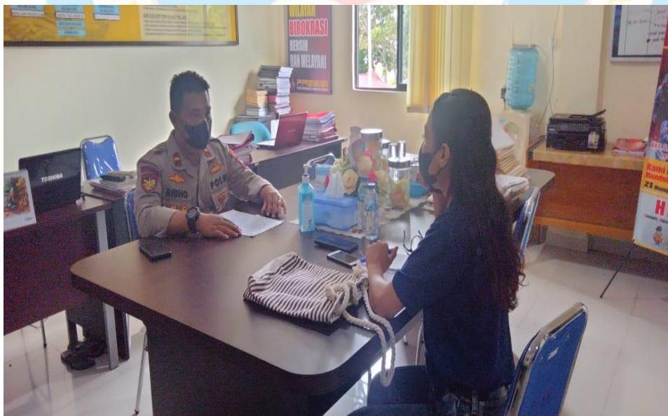
Wawancara bersama dengan Poliair Polres Karimun.