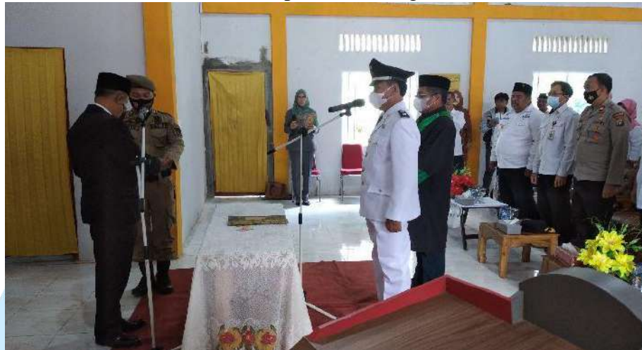
Gambar 1.1. Pelantikan Kepala desa Sungai Sebesi Tahun 2022

yang menjabat selama tiga periode berturut-turut di Desa Sungai Sebesi (Ilfitra, 2022).