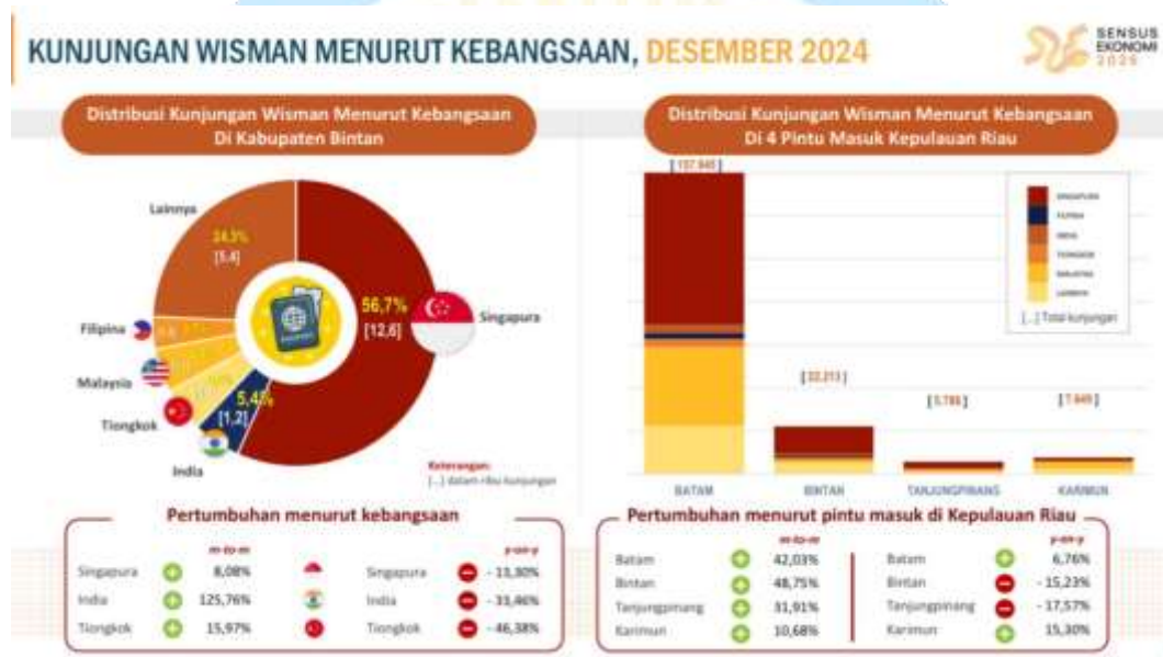
Gambar 1. 2 Kunjungan Wisatawan Menurut Kebangsaan Periode Maret 2024

Sumber : Dinas Kebudayaan dan Pariwisata Bintan 11