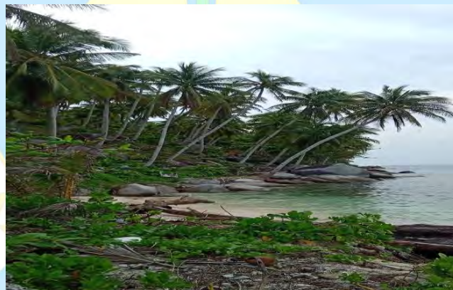
Gambar 1. 2 Tempat Pembuangan Tinja Masyarakat Desa Pengikik Zaman Dulu

Sebagian warga Desa Pengikik masih tidak memiliki fasilitas sanitasi yang memadai di rumah mereka, seperti jamban sehat. Akibatnya, melakukan pembuangan tinja sembarangan seperti di tempat area terbuka menjadi pilihan yang sering dilakukan. Perilaku ini sudah terjadi dari dulu yang dilakukan oleh masyarakat sebelumnya yang tinggal di Desa Pengikik sehingga menjadi sebuah kebiasaan bagi mereka. Berikut gambar tempat pembuangan tinja masyarakat sebelum adanya fasilitas jamban sehat.